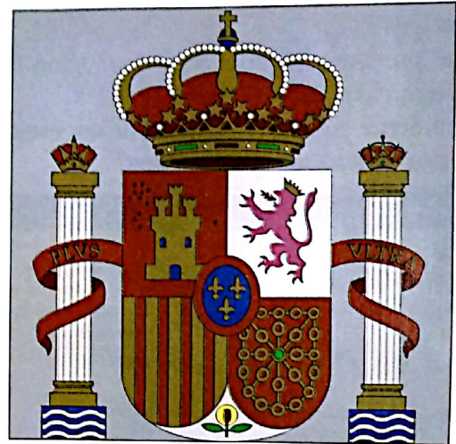
Figura 1 Éste es el escudo del Reino de España. En la parte de arriba está la corona (crown) de los reyes.