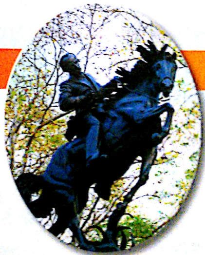
Una estatua de José Martí en la ciudad de Nueva York

Repeating out loud is a good strategy for memorizing any text, such as this poem. It will also help you to remember new vocabulary and verbs.