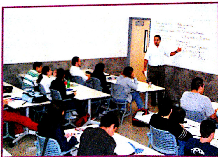
Estos estudiantes mexicanos están tomando apuntes (taking notes) en clase.